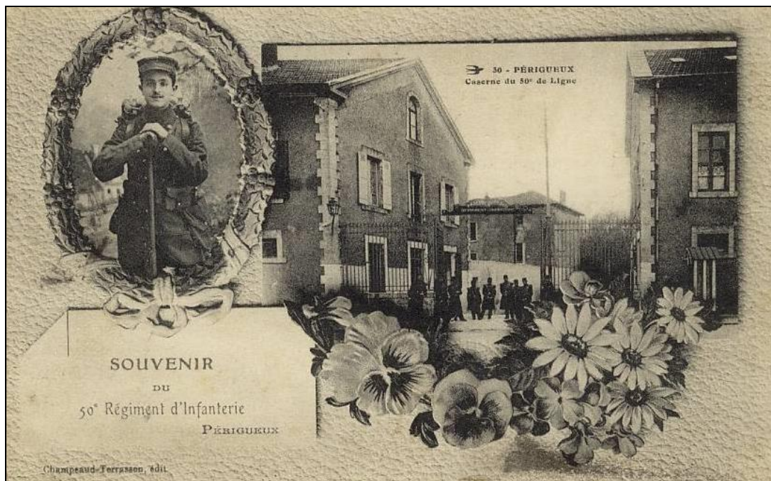
Périgueux, la caserne Bugeaud du 50 ème Régiment d'Infanterie.