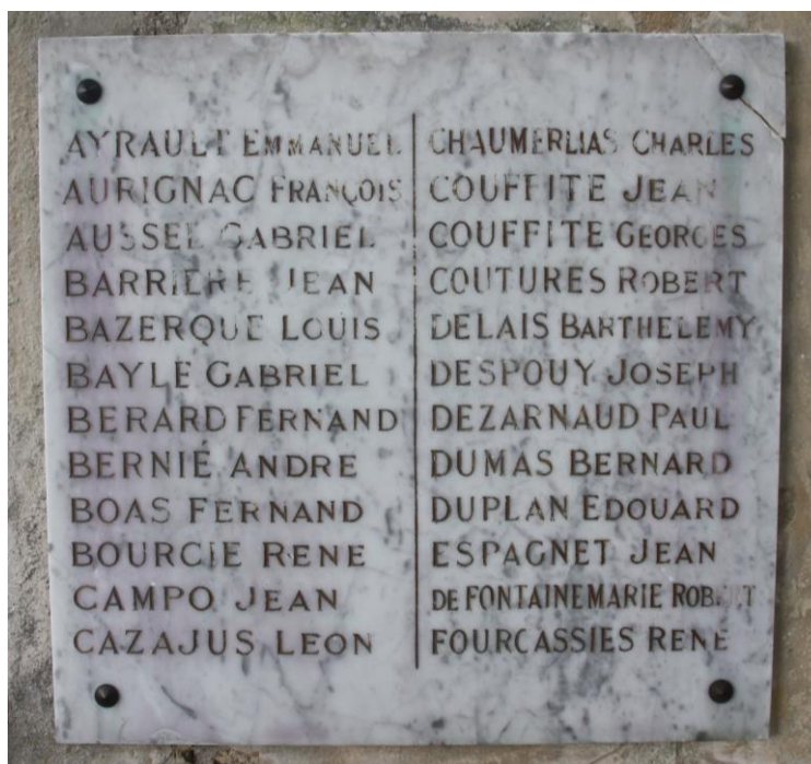
Monument aux Morts de la commune de Loupiac (Gironde)