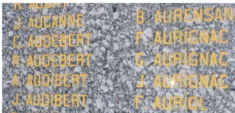
Monument aux Morts de la commune de Bordeaux (Gironde)