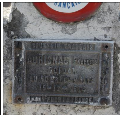
□ Cimetière Nord – Avenue Georges Pompidou 24000 Périgueux.