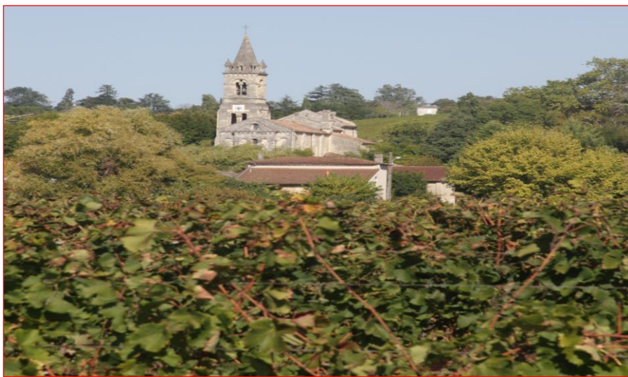
Eglise de Loupiac