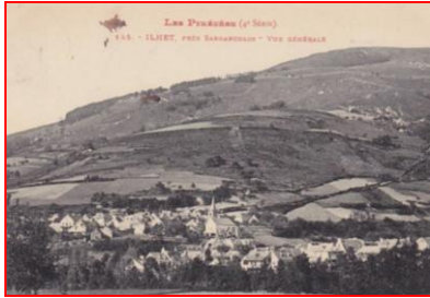
Commune d'Ilhet (Hautes-Pyrénées)

◆ Les origines de la famille Bazerque se situent à l'Ilhet dans les Hautes-Pyrénées. ◆