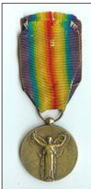
Médaille de la Victoire