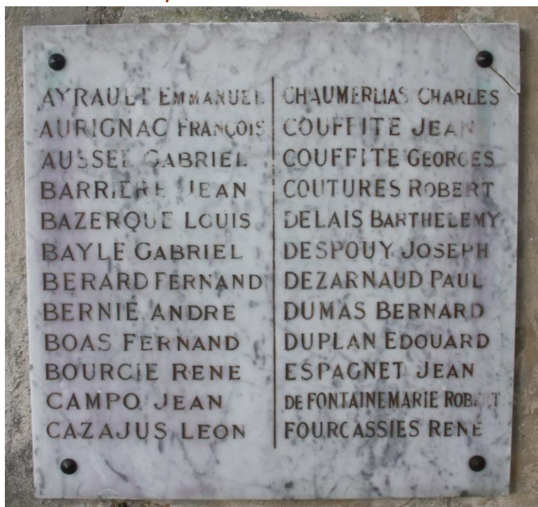
Monument aux Morts de la commune de Loupiac (Gironde).

La transcription de décès du soldat Louis Bazerque est enregistrée sur les registres d'Etat civil de la commune de Loupiac Il est inscrit sur le Monument aux Morts de la commune de Loupiac et sur le livre d'Or