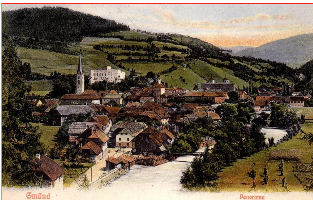
Ville de Gmünd (Bade-Wurtemberg) Allemagne.