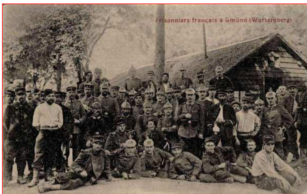
Ville de Gmünd (Bade-Wurtemberg) Allemagne.