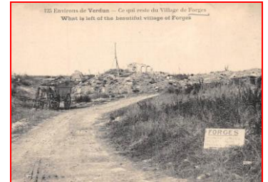
Village de Forges sur Meuse.

Ici, se trouvait Forges ! Maintenant ce n'est plus qu'un amas de ruines,