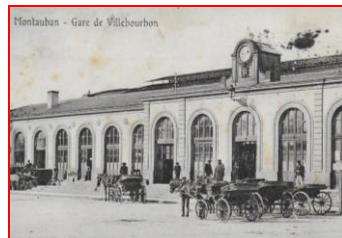
Gare de Villebourbon Montauban.

Louis Bazerque est rappelé à l'activité au 11 ème Régiment à Montauban. Celui-ci embarque avec la 211 ème à la gare de Villebourbon pour une « destination inconnue »