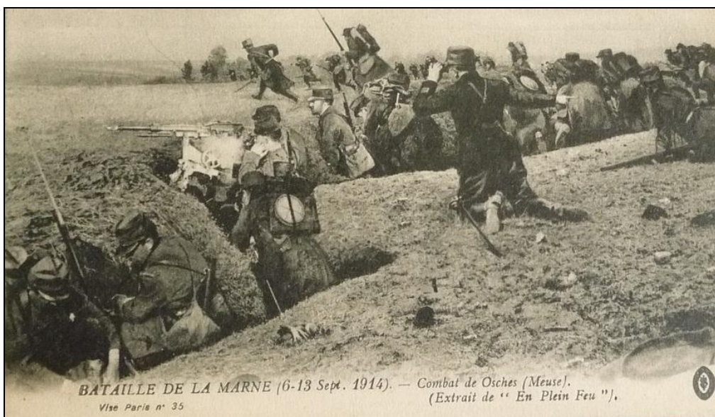
BATAILLE DE LA MARNE (6-13 Sept. 1914). — Combat de Osches (Meuse). (Extrait de " En Plein Feu "). Visé Paris n° 35

▣ Internet/mémoire des hommes - journaux des unités (1914-1918).