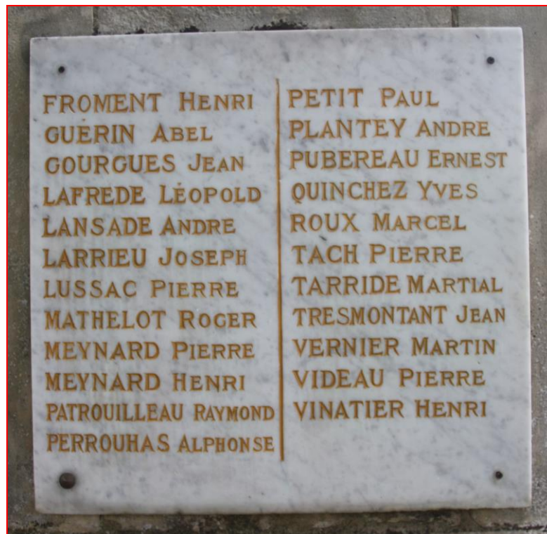
Monument aux Morts de la commune de Loupiac (Gironde)