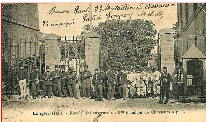
Longwy, la caserne du 9 ème Bataillon de Chasseurs à pied.