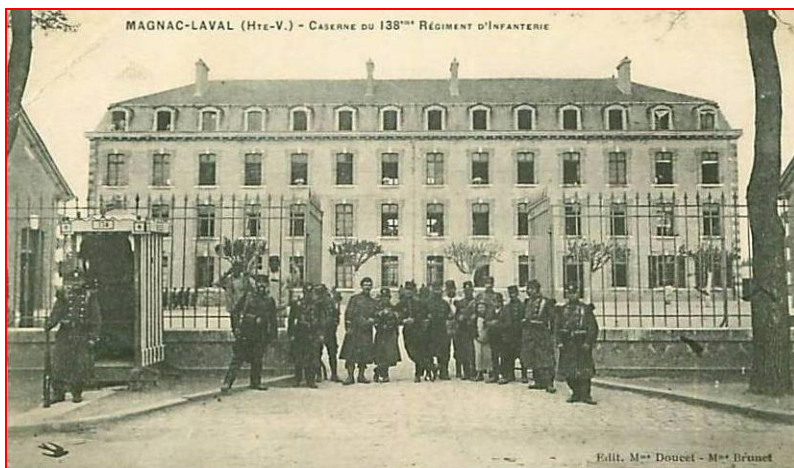
Magnac-Laval, la caserne du 138 ème Régiment d'Infanterie.