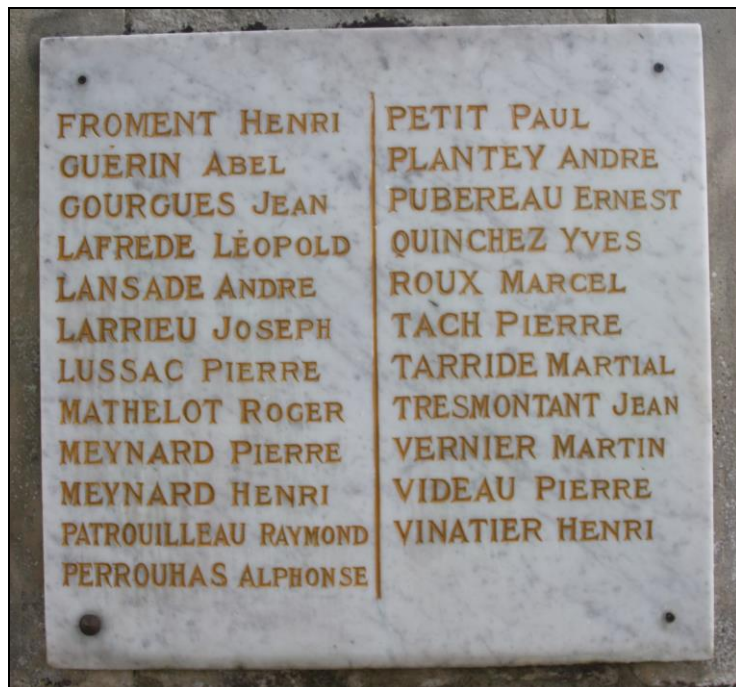
Monument aux Morts de la commune de Loupiac (Gironde)