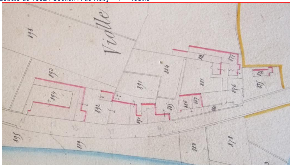
Plan cadastrale de 1852 : Section A de Roby – 4 ème feuille